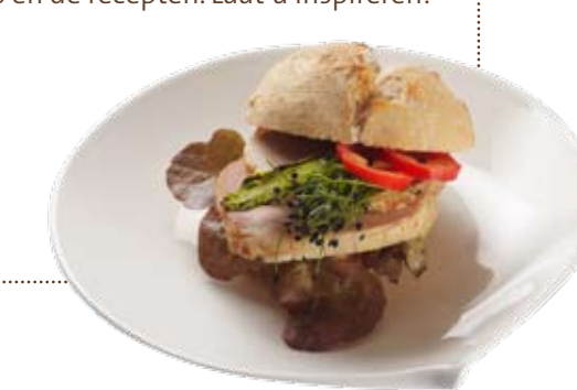
RONDO ROBUSTICO met gevulde kiprollade