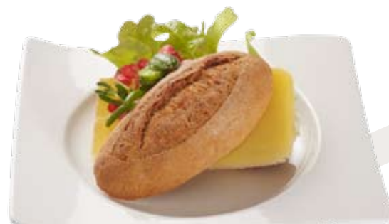
SIEGOLET met kaas van het Brandrode rund