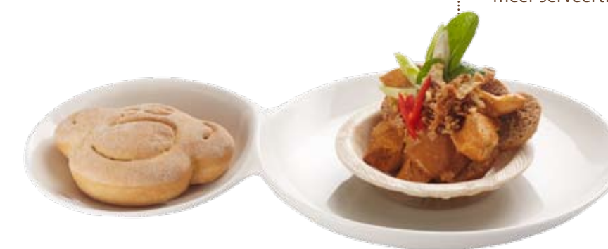
ECHT BROODJE AAP op oosterse wijze