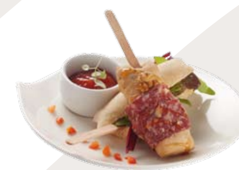
BROLLIE met hertenborst

We hebben een dagje in de keuken doorgebracht en alle creativiteit losgelaten op onze broodjes. Hier alvast een voorproefje van diverse lunchgerechten. Op www.carlsiegert.com vindt u nog veel meer serveertips en de recepten. Laat u inspireren!