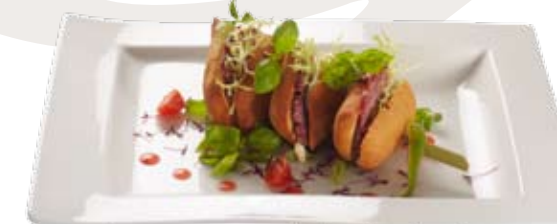
CRISPANINI REYPENAER op een stokje