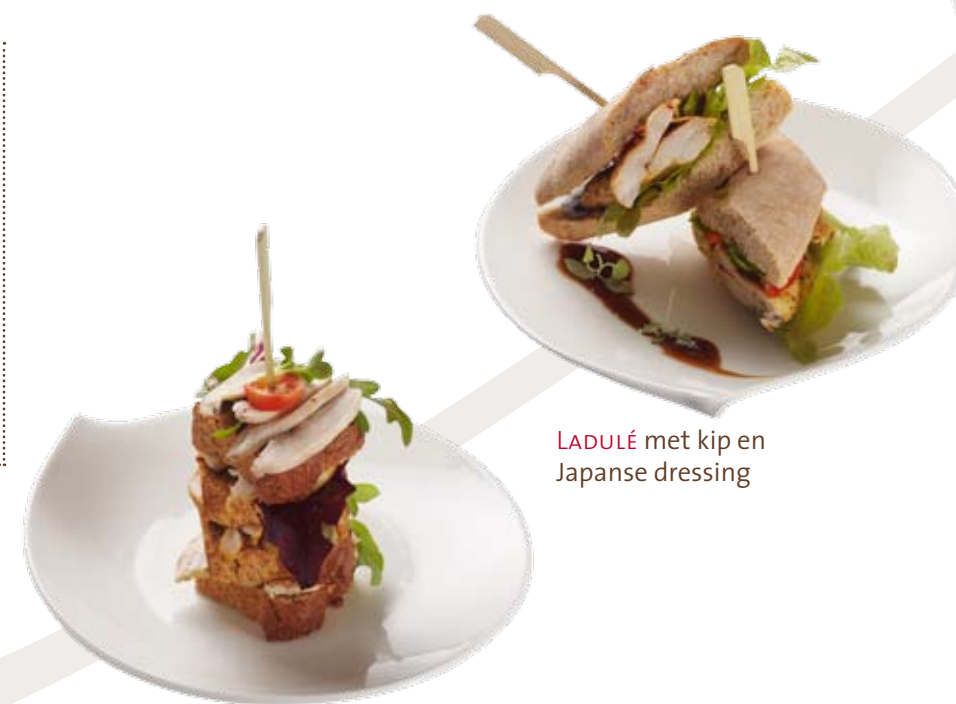
Clubsandwich van PAIN QNIP